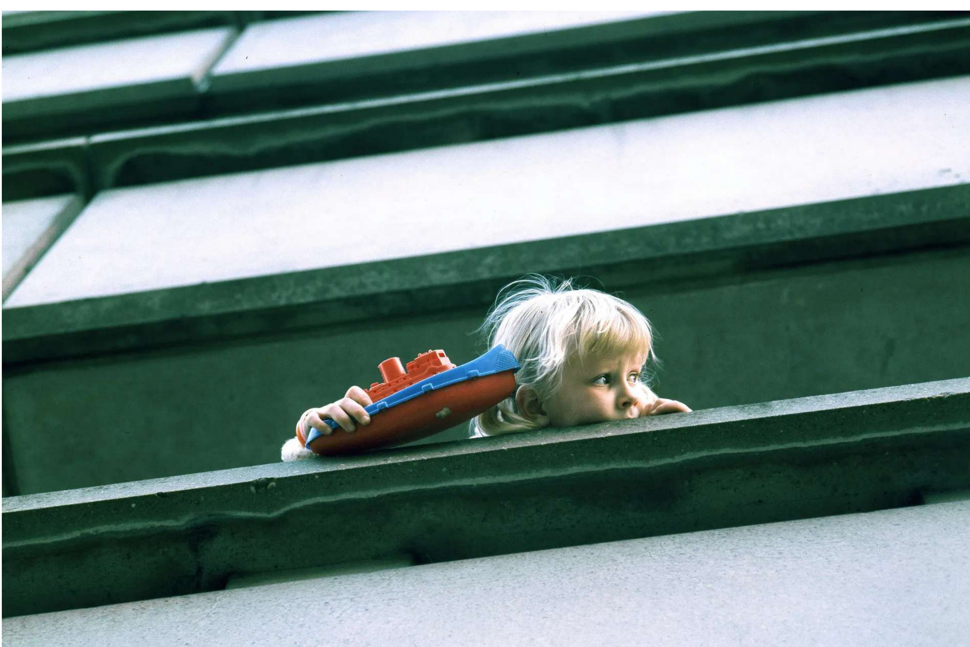
Kind met speelgoed in Bijlmermeerflat, 1971.